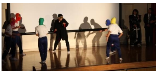
「プロローグ（オープニング劇）」