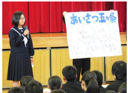
全校集会での呼びかけ