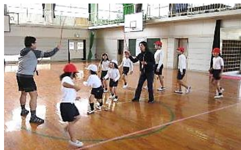
2/6長縄記録会で、3分間210回達成！

今年度も保護者や地域の皆様の温かいご支援ご協力により、子供たちの成長のお手伝いをさせていただくことができました。全教職員が真摯に一人ひとりの子供と向き合っていました。課題はまだありますが、今年度の成果や課題を振り返り、これからも課題解決に向けて取り組んでまいります。今後ともどうぞよろしくお願いいたします。