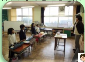
【1. 2年 音楽】

今年初めての参観日がありました。各クラス一生懸命勉強しています。しっかりと学年のまとめをして、新しい学年を迎えて欲しいです。