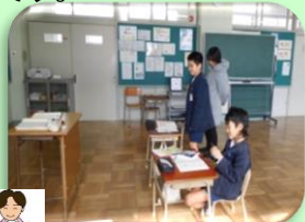
【3. 4年 算数】