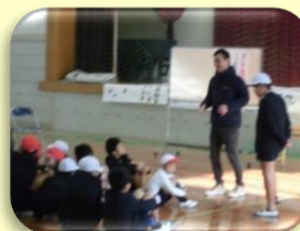
学年関係なく笑顔いっぱい