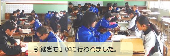
引継ぎも丁寧に行われました。