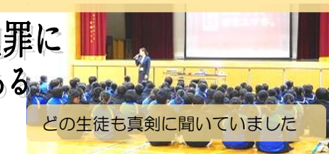
どの生徒も真剣に聞いていました

全校生徒を対象に「情報モラル研修会」を開催しました。今年、NTT ドコモと警察署の方を講師に招き、「ネットの危険性」について、具体的な話をいただきました。