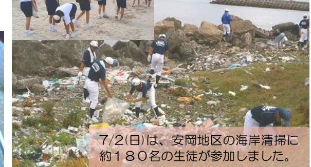
7/2(日)は、安岡地区の海岸清掃に約180名の生徒が参加しました。