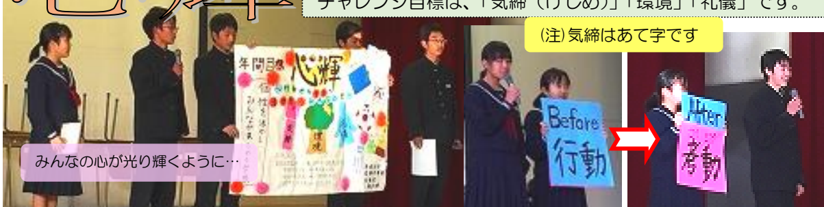
みんなの心が光り輝くように...