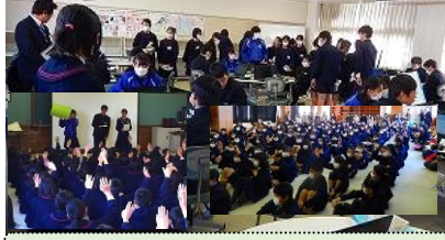
2/14(火)に、安岡小学校の6年生が中学校の見学に来ました。授業や部活動の様子を真剣に見ていました。