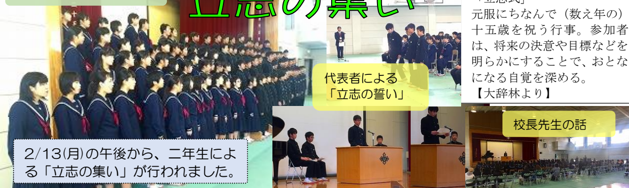
代表者による「立志の誓い」