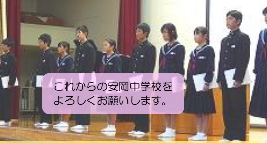
これからの安岡中学校を よろしくお願いいたします。

三年生の生徒会役員・専門委員長の皆さん、お疲れ様でした。ありがとうございました。