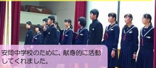
安岡中学校のために、献身的に活動 してくれました。

三年生の生徒会役員・専門委員長の皆さん、お疲れ様でした。ありがとうございました。