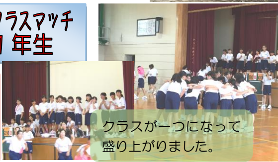
クラスが一つになって盛り上がりました。