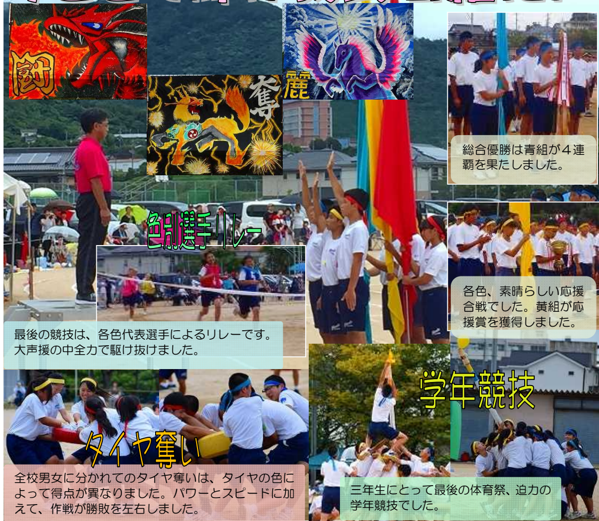
総合優勝は青組が4連覇を果たしました。