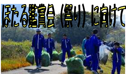
安岡自治会連合会主催の「友田川合同清掃」が行われました。約90名の中学生がボランティアとして参加しました。ほたる鑑賞会が楽しみです。

自身の体験やアニメのキャラクターを題材にして、生徒に分かりやすく語りかけられました。