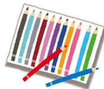
いろえんぴつ 色鉛筆