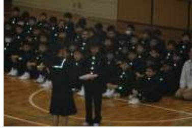
歓迎のシュプレヒコール