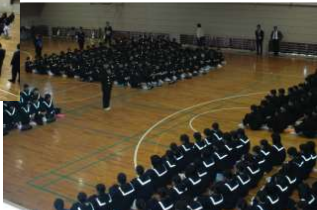
在校生歓迎の言葉 代表・生徒会