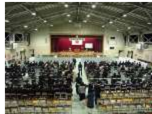
卒業生入場を待つ時間。