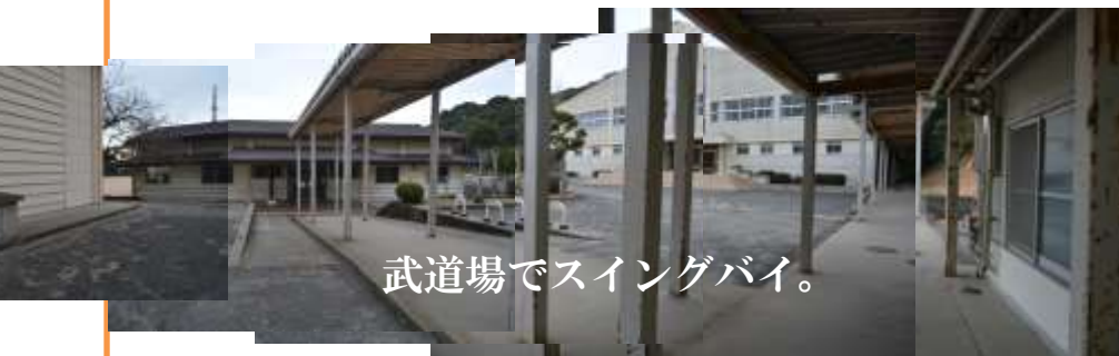
見えてきた体育館。