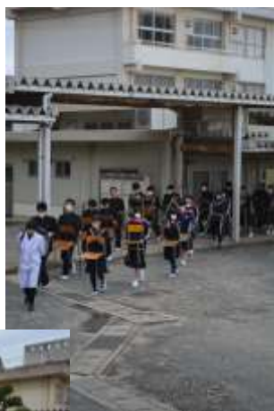
生徒は椅子を持って