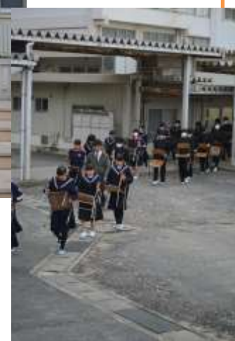
言葉少なく、 さすがは3年生。