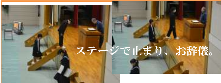
ステージで止まり、お辞儀。