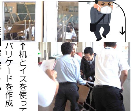
↑机とイスを使ってバリケードを作成

6月25日（火）に不審者対応避難訓練及び保護者引き渡し訓練を実施しました。本年度は小中連携の一環として、関西小学校・桜山小学校と連携した訓練でした。授業中に不審者が校内に侵入したことを想定し、放送の指示を受け各教室では実際に机やイスを使ってバリケードを築く練習もしました。引き渡し訓練ではお忙しい中ご協力をありがとうございました。