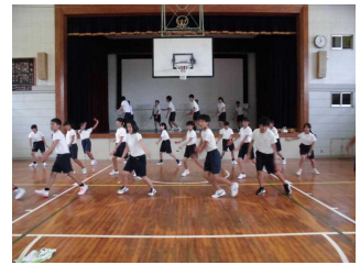
(よさこいの授業風景)

【日程】13時40分～14時00分 講演 14時10分～15時20分 総合的な学習体験 (よさこい・平家太鼓・演劇・ピクセル)